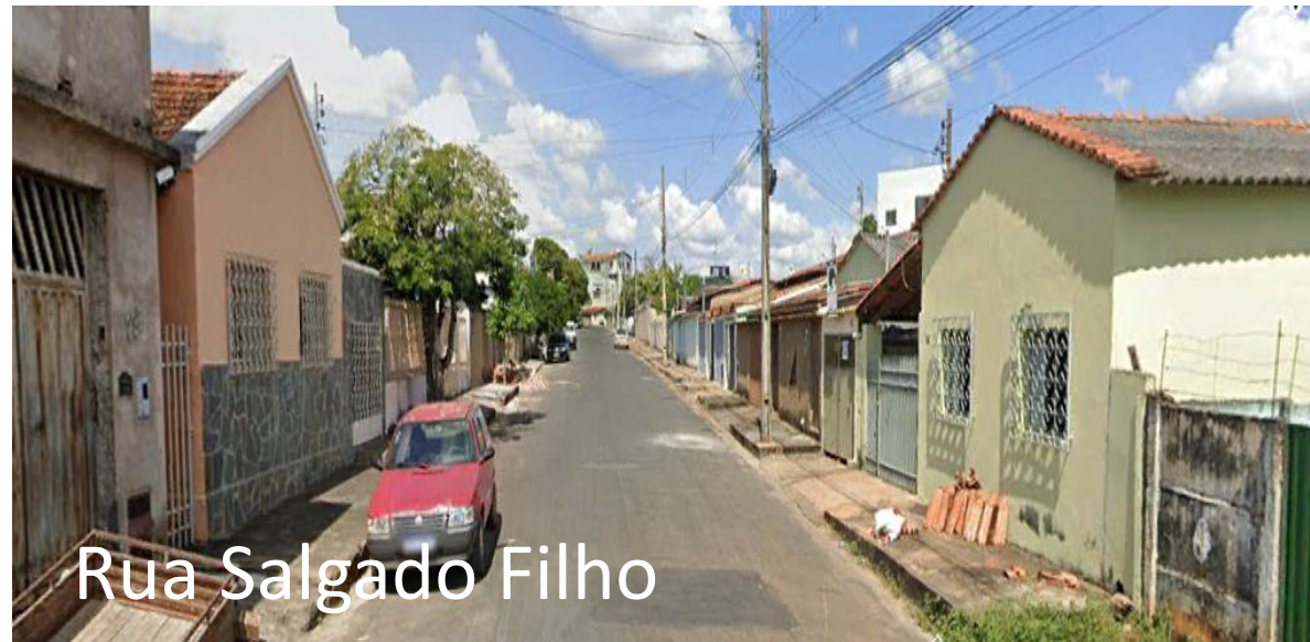
Rua Salgado Filho