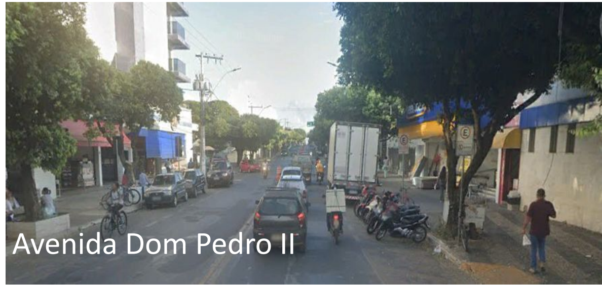
Avenida Dom Pedro II