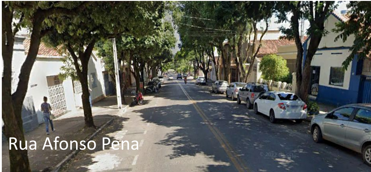
Rua Afonso Pena